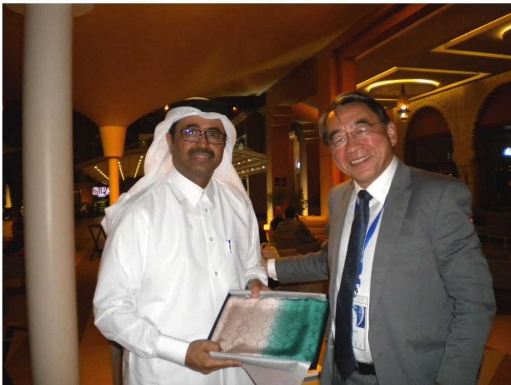
写真1 HE Dr. Mohammed bin Saleh Al Sada, カタール エネルギー・工業大臣(左)との面談後

HE Dr. Mohammed bin Saleh Al Sada, カタール エネルギー・工業大臣との面談では、カタールとのJCCP事業、カタールの石油情勢・エネルギー政策などについて、意見交換を行い、先方からの研修要望を聴取しました。