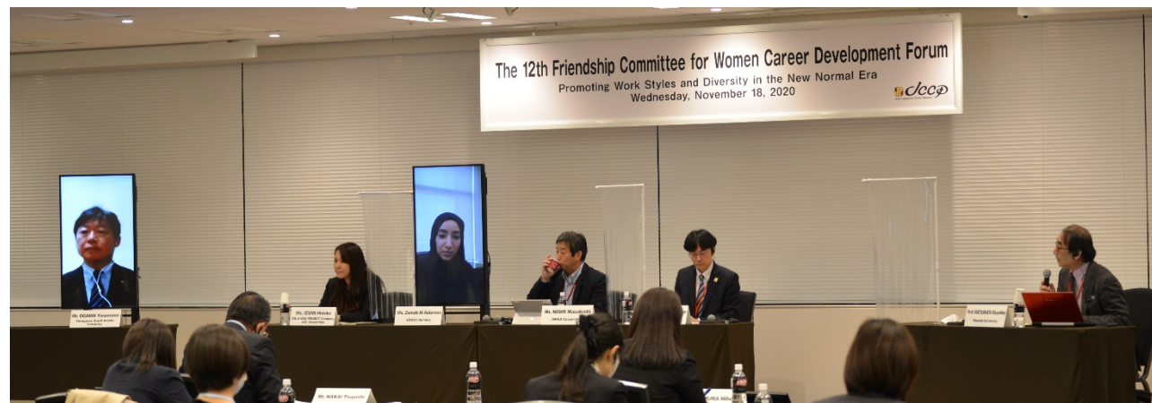
パネルディスカッション 2： “現業部門における先進技術の活用”