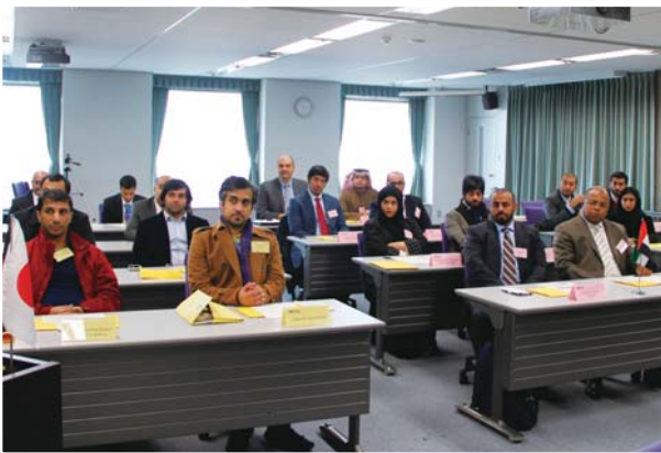
2月9日 CPJ-83「生産性向上のための製油所保全管理」(2月9日～20日)、 CPJ-84「石油マーケティングトレーディング」(2月9日～13日) —ADNOCグループ対象のカスタマイズド研修合同開講式—