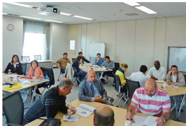
11月19日 TR-14「人事管理」(11月4日～21日) —JCCPでのグループ討議—