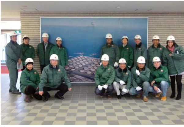
1月26日 TR-20「石油物流」(1月13日～30日) —JX日鉱日石基地喜入にて—