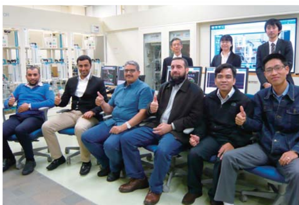
12月3日 TR-19「石油ダウンストリームにおける情報および制御システムの活用」 (11月15日～12月12日) —JCCP シミュレーションルームにて—