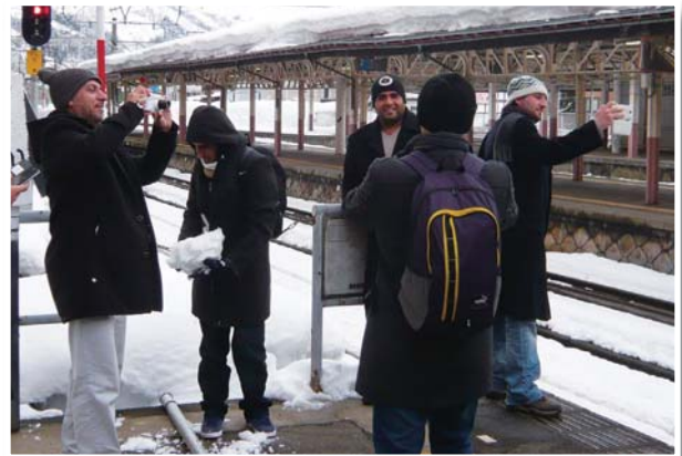
1月29日 CPJ-82「環境管理と先進技術」(1月27日～2月6日) —越後湯沢にて雪景色にびっくり—