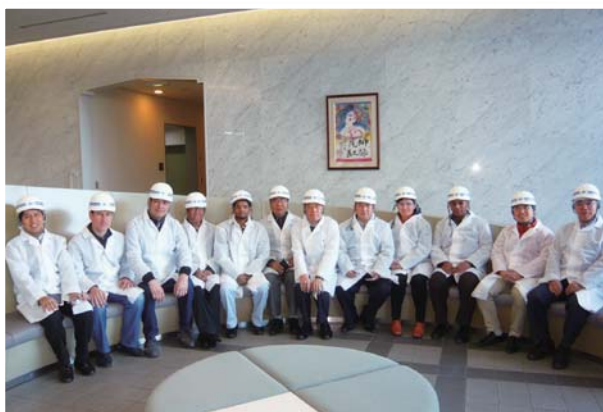
11月13日 TR-15「LNG技術の現状と将来動向」(11月4日～21日) —神戸製鋼所での集合写真—