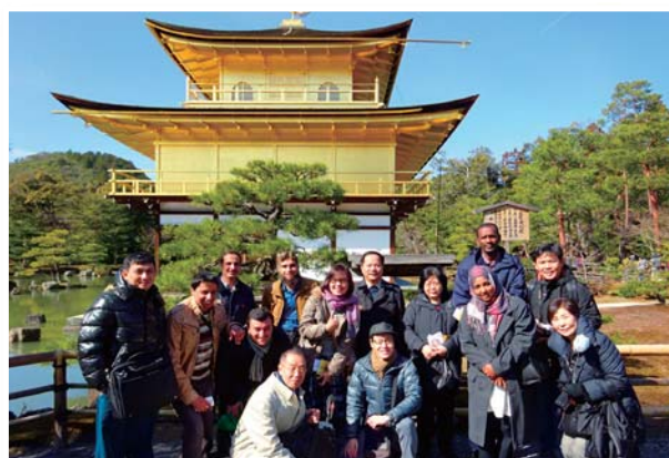
2月21日 TR-21「品質管理」(2月10日～27日) —歴史文化研修で金閣寺にて—