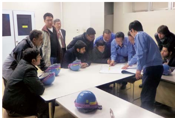
1月19日 IT-3「定期整備と日常管理」(1月13日～23日) —出光千葉製油所での現場実習—