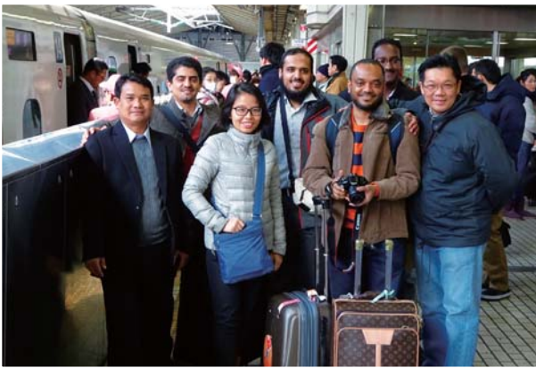
2月27日 TR-23「人材開発」(2月17日～3月6日) —移動の新幹線前で—