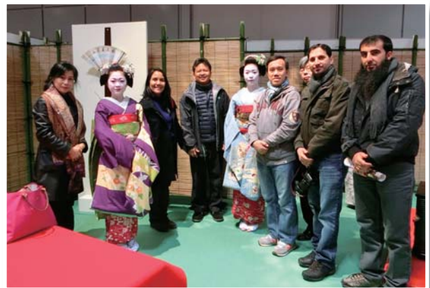
12月14日 TCJ-1「JCCPプログラムセミナー」(12月11日～17日) —歴史文化研修で京都舞妓さんと—