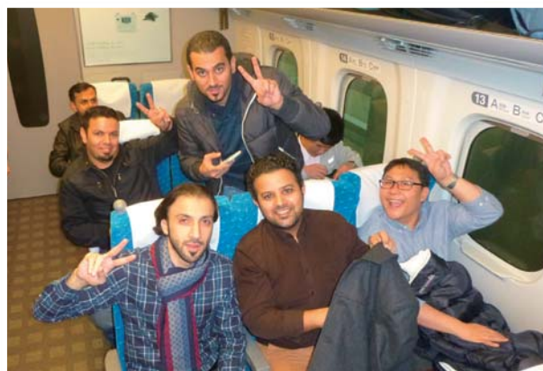
12月4日 TR-17「安全管理」(11月25日～12月12日) —広島へ移動する新幹線にて—