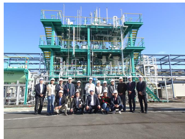
千代田化工建設（株）子安オフィス・リサーチパーク